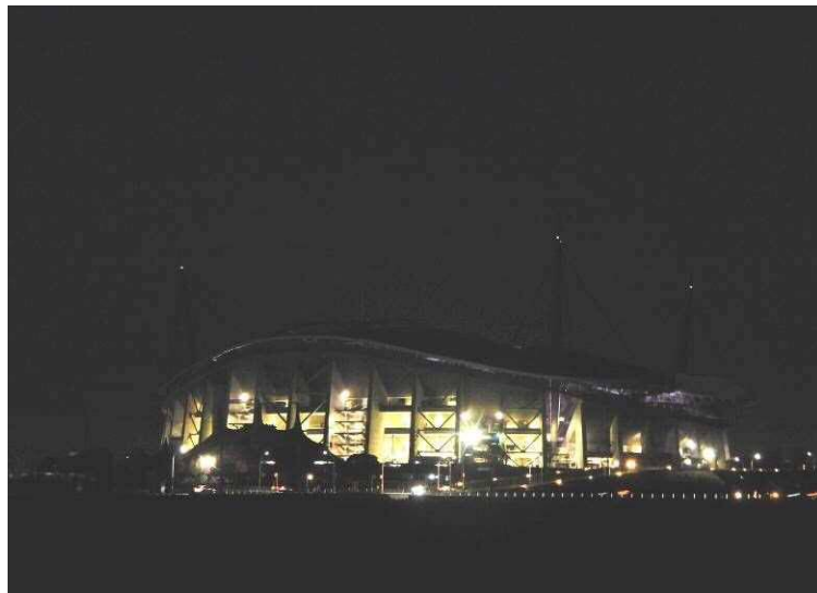
スパルタンレース会場を早朝に準備中のスタジアム