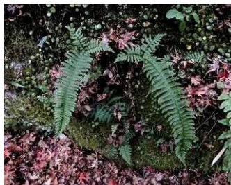
ジュウモンジシダ