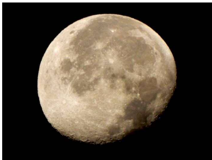
早朝6時の西の空の十八夜の月

十八夜の月が西の空で明るく輝いていました。豊田スタジアムかでの日の出は6時57分頃です。