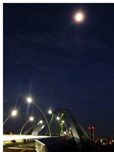
豊田大橋の頭上の月