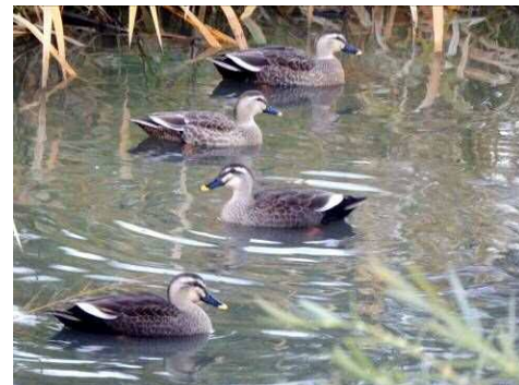
修景池のカルガモ