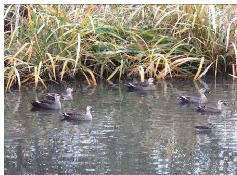
修景池のカルガモ