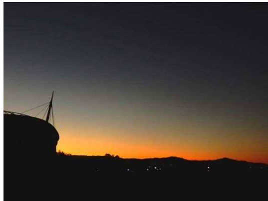
日の出前の東の空 (6:06)