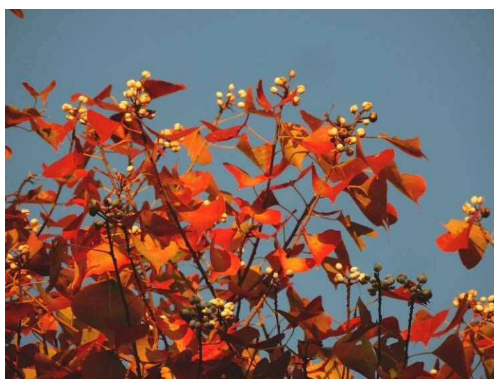
ナンキンハゼの紅葉