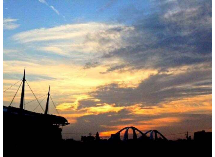
10月30日の日没風景（午後4時40分）