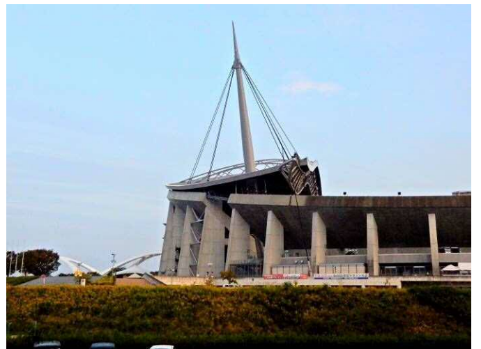
加茂川堤のセイタカアワダチソウ