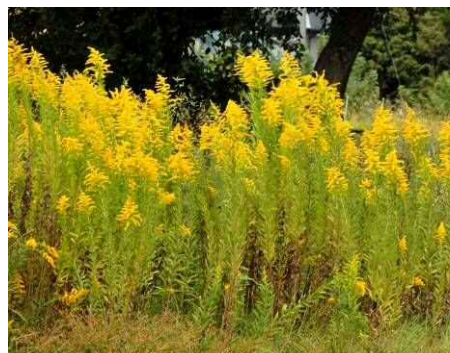
セイタカアワダチソウ