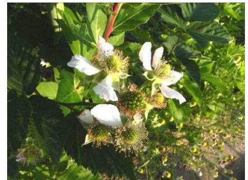
アドベリー (ボイセンベリー)