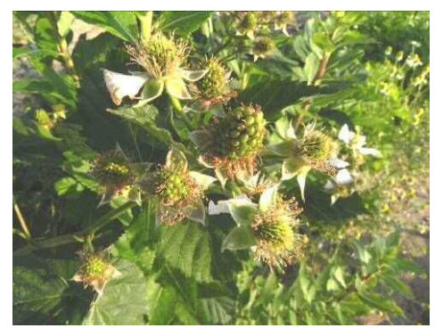
アドベリー (ボイセンベリー)