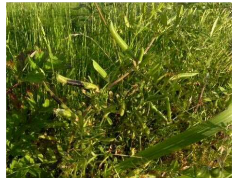
カラスノエンドウの果実