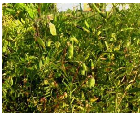
スズメノエンドウの果実