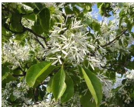
ヒトツバタゴの花