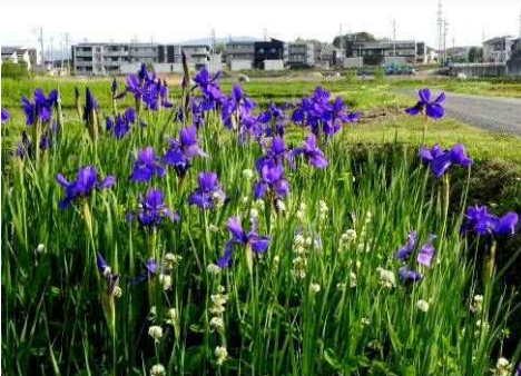
アヤメ開花最盛期