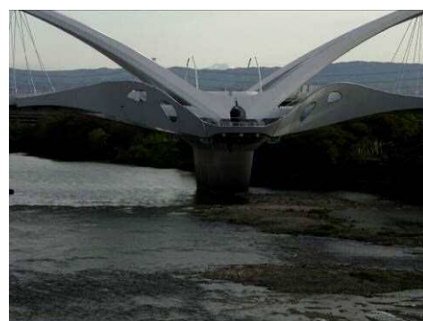
豊田大橋の遠方に御嶽山が！