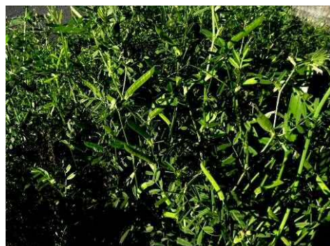
カラスノエンドウ