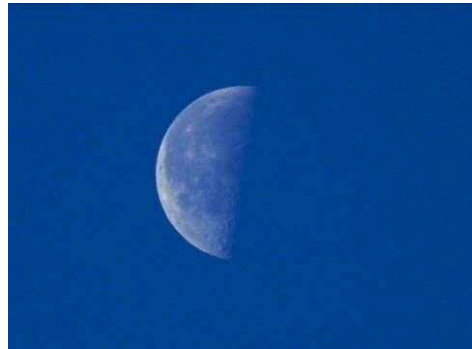
早朝の二十三夜の月