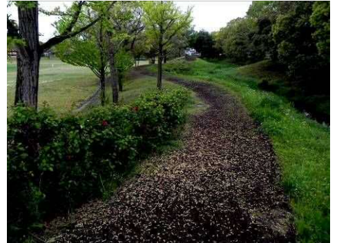
イチョウの雄花が一面に落ちる