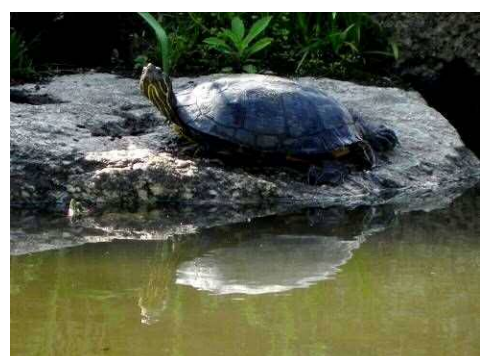
ミシシippアカミミガメ