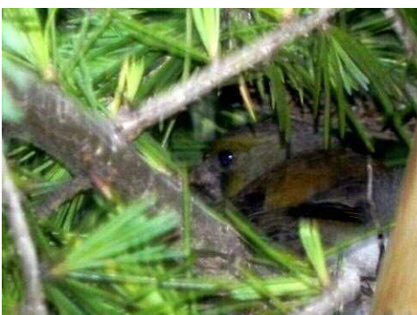
巣簞っている鳥は何鳥？