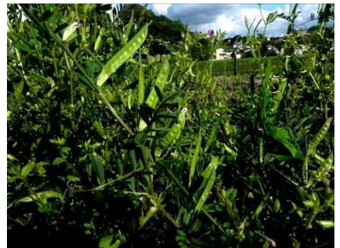
カラスノエンドウ