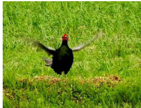
キジの母衣打ち（ホロ打ち）