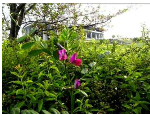
カラスノエンドウ