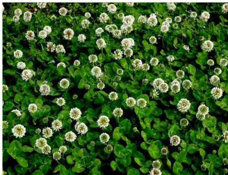
三つ葉のシロツメクサ