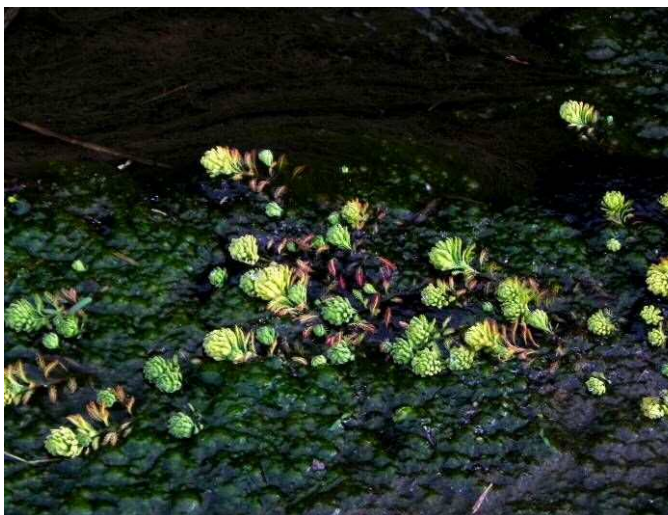
水路の水草に新芽が