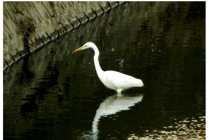
加茂川のダイサギ