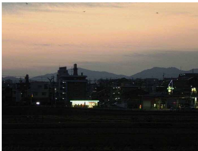
日の出前の東の空（6時10分）