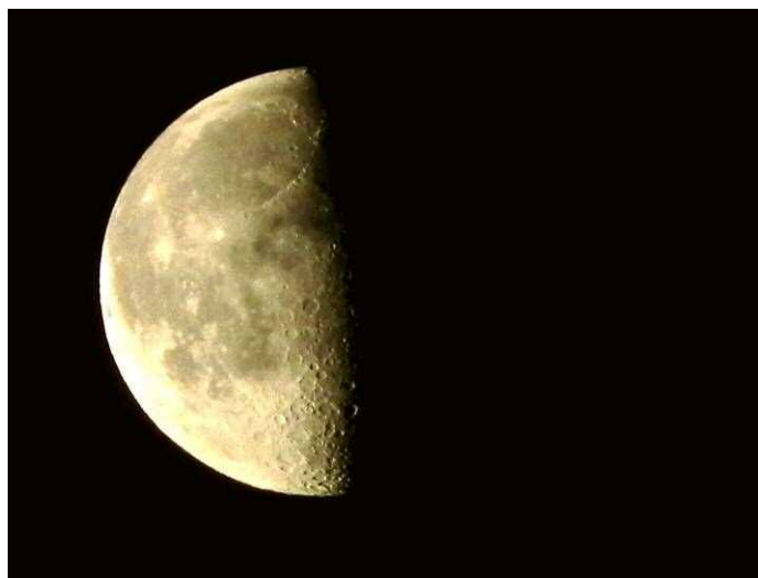
早朝の月二十一夜の（26日）