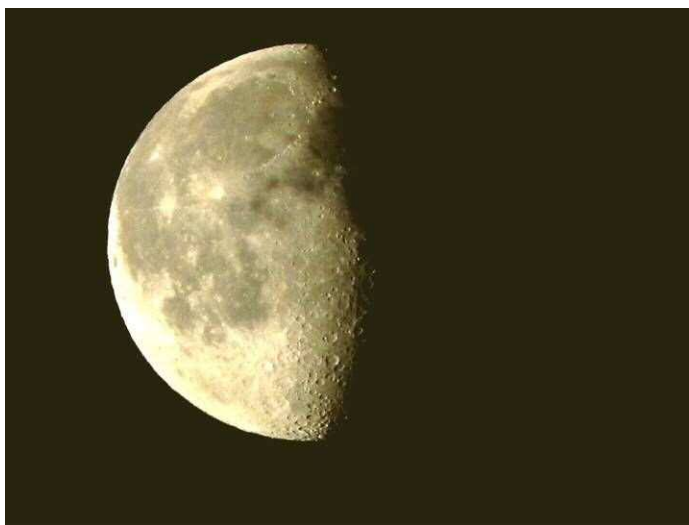
早朝の二十夜の月（25日）