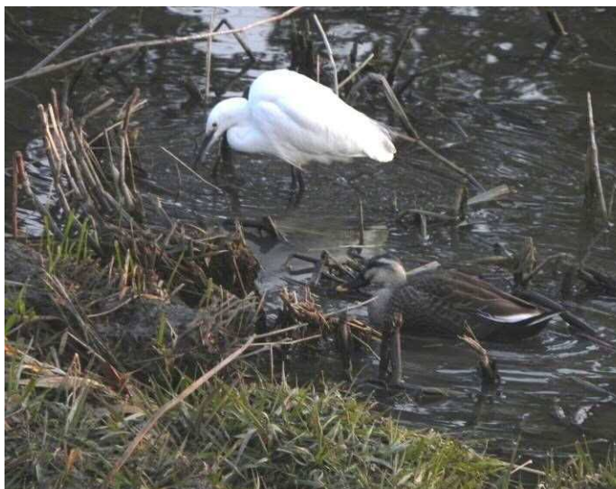
修景池のコサギとカルガモ