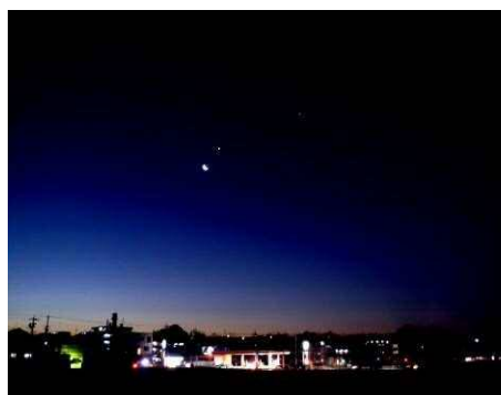
午前 6 時 10 分頃の東の空