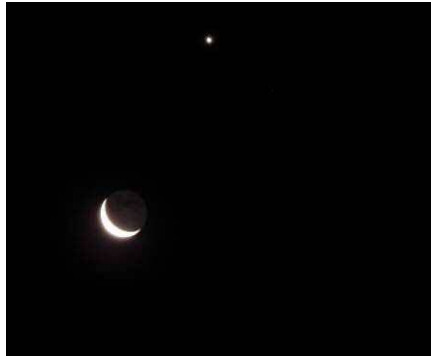
二十六夜の月と金星