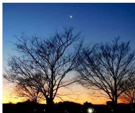
午前 6 時 20 分頃の東の空