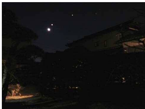
東の空の月と金星と木星

早朝 5 時半頃、まだ暗い東の空に二十六夜の月とその近くに金星、そして木星が輝いている光景が目に入りました。カメラに収めるのには苦労しましたがなんとか記録できたように思います。