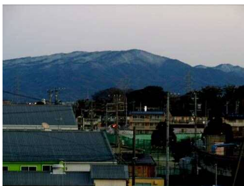
うっすらと雪をかぶった猿投山