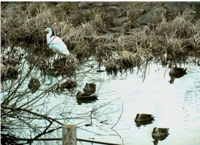
修景池のダイサギとカルガモ