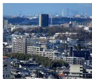
遠方に名古屋駅のビル群が