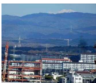
遠方に木曽の御岳山が