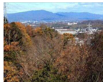
自然観察の森展望台より