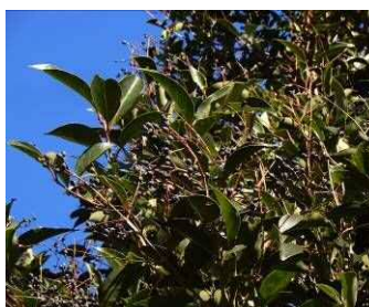
ネズミモチの果実