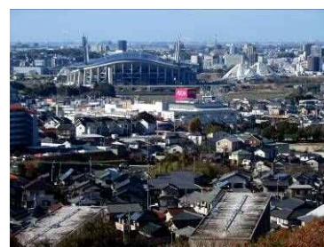
豊田スタジアム方面