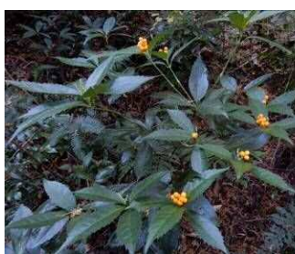
黄実のセンリョウ