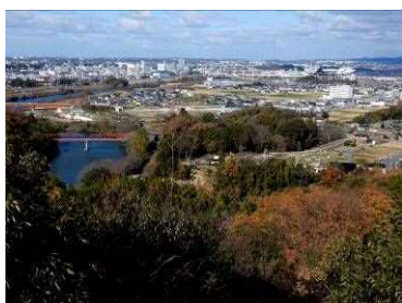
野見山の展望台より