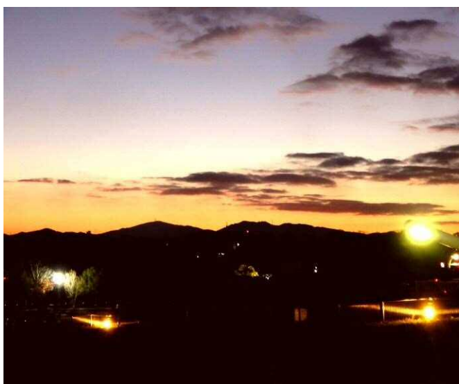
12月15日の日の出50分前