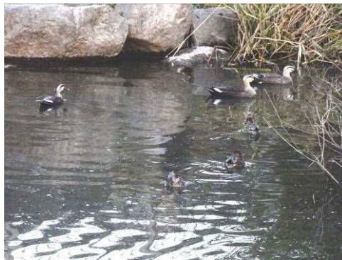
修景池のカルガモ