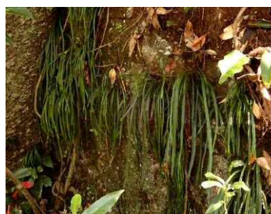
シシラン (シダ植物)