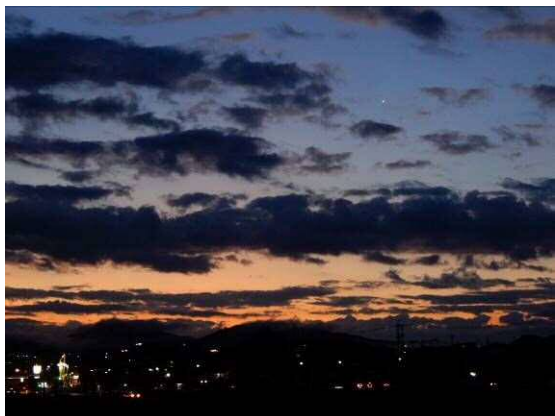
東の空には金星が

早朝の散策に出かける5時50分頃はまだ暗く、東の赤い空と金星の輝きが目に入ってきています。 豊田市での今日の日の出時刻は6時35分頃です。土手ではヒガンバナの開花がまだ見られ驚きです。