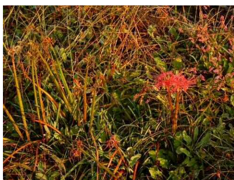
ヒガンバナ開花中