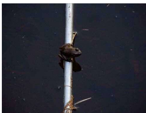
ウシガエルの子どもがまだいた