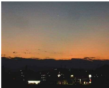
日の出40分前の東の空

今朝は日の出前の気温は13℃と温かく、矢作川のダイサギやカワウは群れて活動を開始していました。豊田スタジアム付近の日の出時刻は6時半を過ぎるようになりました。