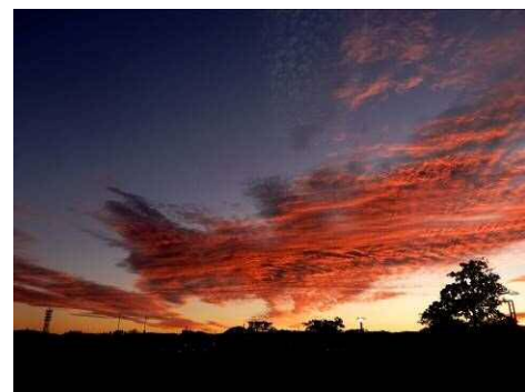
日の出30分前（午前6時頃）