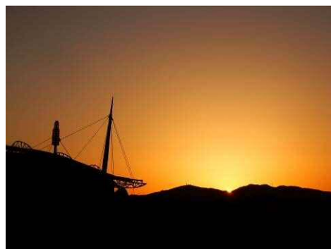
豊田大橋の西側堤防からの日の出