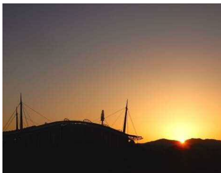
日の出時刻 6 時 1 9 分頃