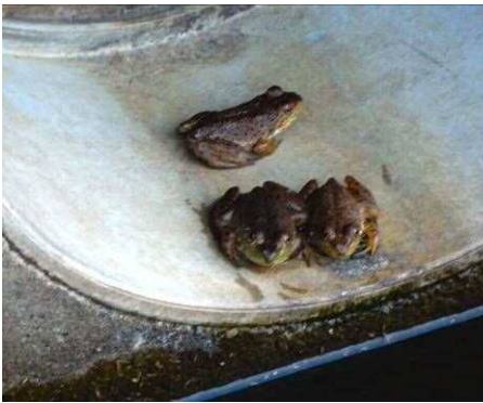
ウシガエルの子ども