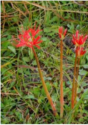
まだヒガンバナが

早朝の身近な自然はあちこちで私に感動を呼び起こし、思わずカメラを向けさせてしまいます