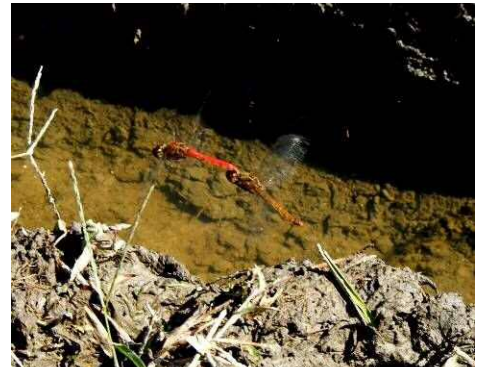
産卵中のトンボの番い