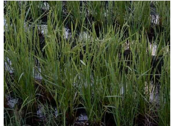
切り株から出た若稲に穂が！