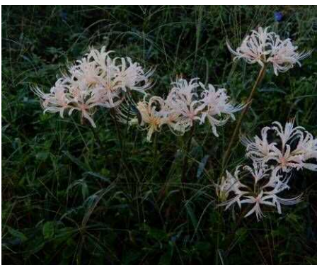
シロバナマンジュシャゲ