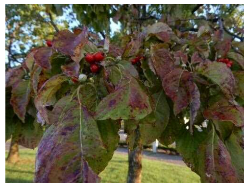
アメリカヤマボウシの果実