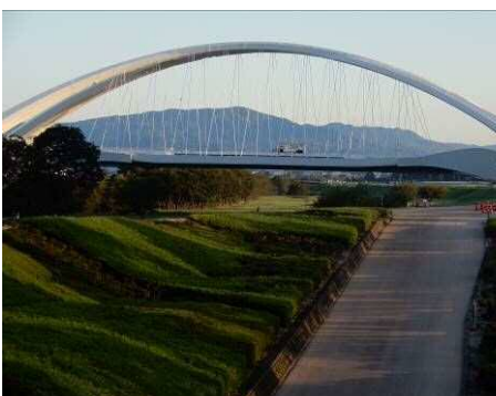
豊田大橋と猿投山