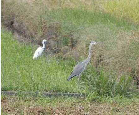
ダイサギとアオサギ

早朝の気温16℃でこの夏以降最低の涼しい気温でした。早生の稲刈り後の水田では、切り株から出た若稲に二度目の小さな穂が付いていました。天気がよく遠方の木曽の御嶽山がよく見えました。