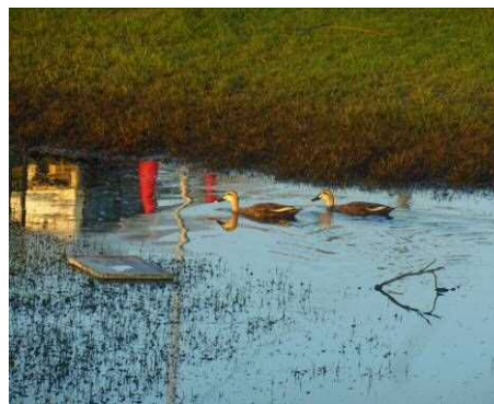
芝生広場にまだ水がついている