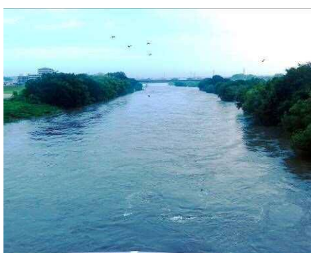
豊田大橋から高橋方面を