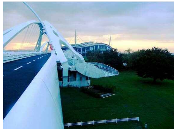
河川敷は冠水を免れた