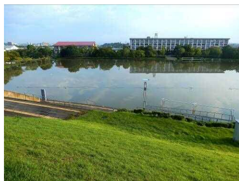
芝生広場は一面水没