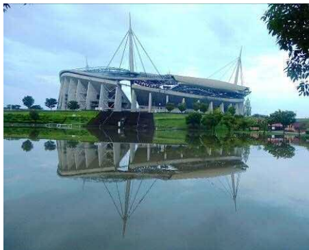
芝生広場は一面水没