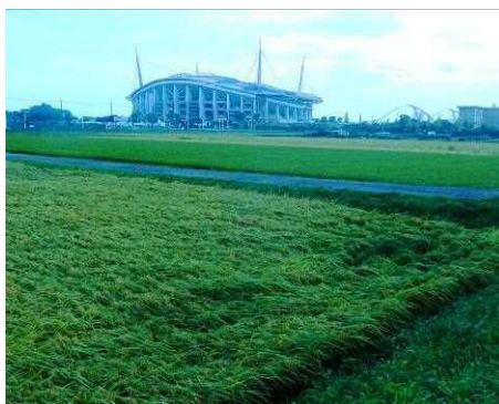
稲田はなんとか無事

近年に無い強風の台風21号が通過した早朝、豊田スタジアム周囲では被害はあまり無くほっとしました。