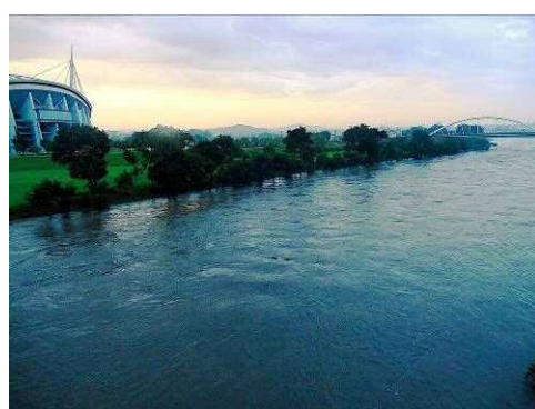
豊田大橋から久澄橋方面を