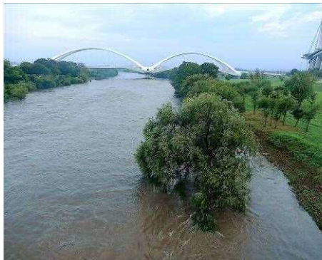
久澄橋より豊田大橋方面を