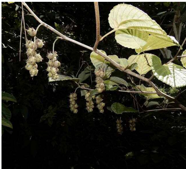
トサミズキの果実