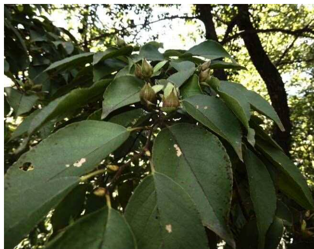
ナツツバキの果実