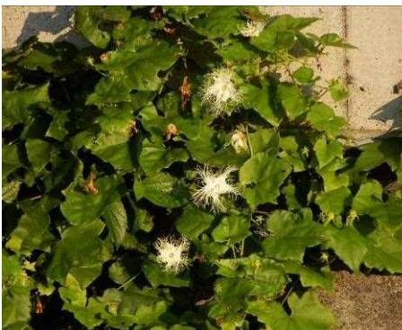
カラスウリ開花中