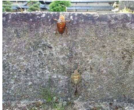
アブラゼミ羽化直後