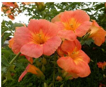
ノウゼンカズラの花