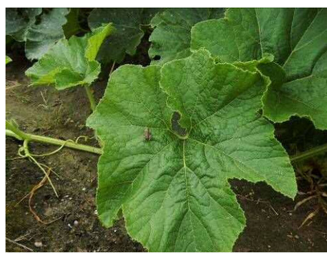
ヌマガエルの子ども