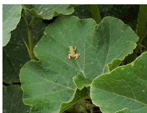
ニホンアマガエルの子ども