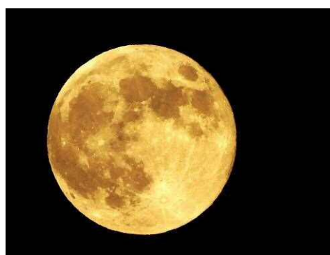
ストロベリームーン