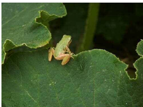
ニホンアマガエル