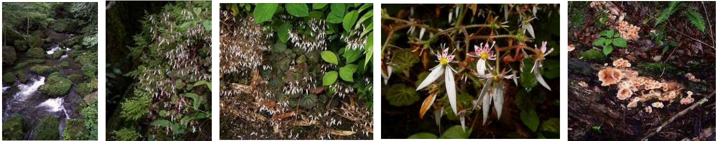
ユキノシタ開花中

雨上がりの王滝渓谷ではユキノシタの開花がまだ進行中でした。梅の名所でもある上流の椿木園地では、梅の果実が成熟中でした。