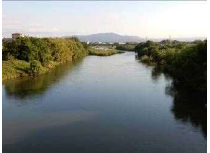
豊田大橋より上流を