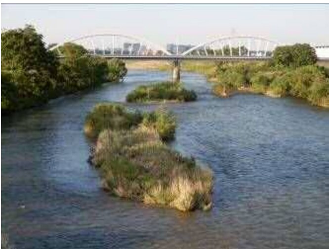
豊田大橋より下流を