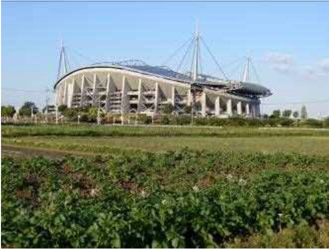
ジャガイモに花が咲き始めている

連休中の晴天で空気のさわやかな早朝、豊田大橋からの矢作川や豊田スタジアム周囲にカメラを向けました。