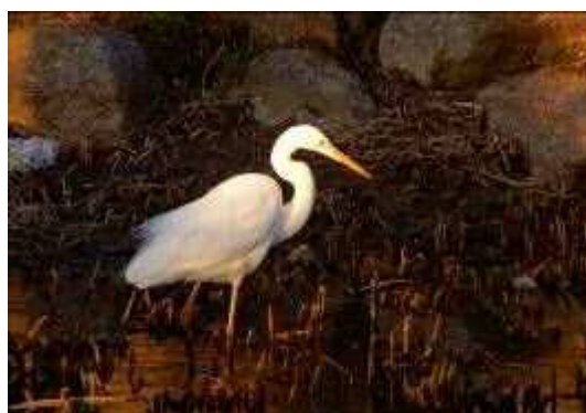
修景池のダイサギ