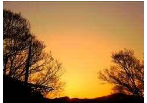
日の出 6 時 1 8 分