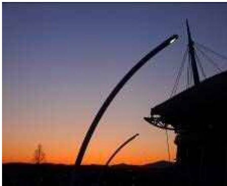
日の出 25 分前