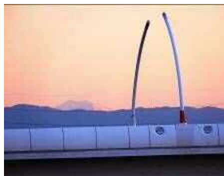
遠方に木曽の御嶽山