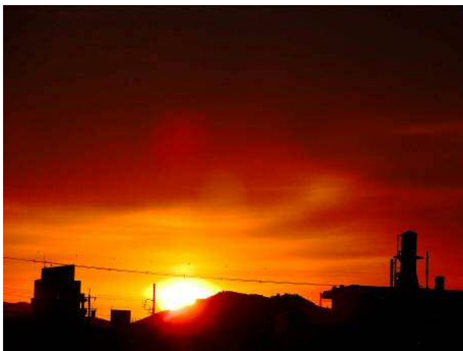
六所山中腹からの日の出（午前7時）