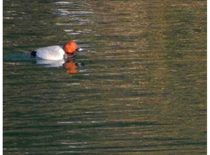
ホシハジロ (カモ科)