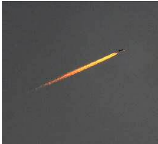
飛行機雲も朝焼け