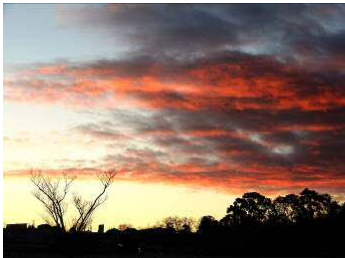
東南の空の朝焼け（6時55分頃）