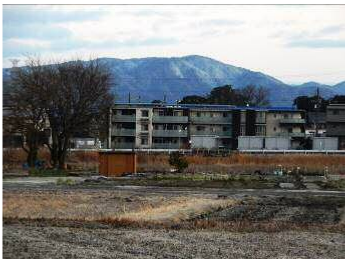
猿投山の上部にはうっすらと雪が