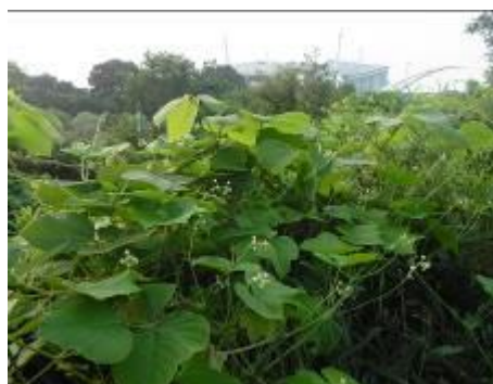
特定外来生物に指定されているつる植物のアレチウリ