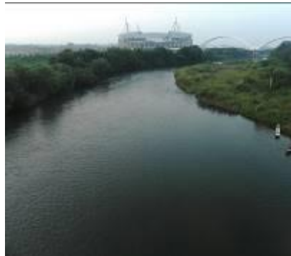
高橋からの矢作川