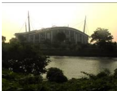
矢作川と豊田スタジアム