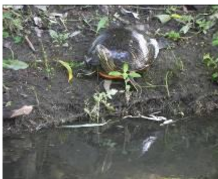
ミシシippアカミミガメ