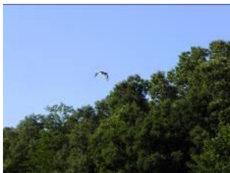
アオサギが飛んでいく