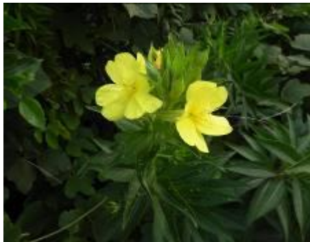
アレチマツヨイグサ

稲の穂に花が咲く水田がスタートしました。土手ではアレチマツヨイグサやコオニユリの花も咲き始めていました。ハンゲショウの白い葉が真っ盛りのシーズンも迎えています。