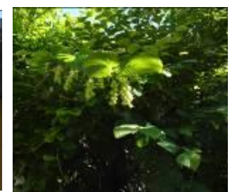
トサミズキの果実