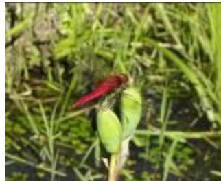
ショウジョウトンボ