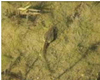
トノサマガエルのオタマジャクシ