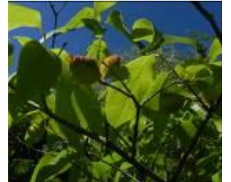
ソシンロウバイの果実