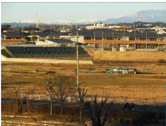
遠方に中央アルプスと恵那山が