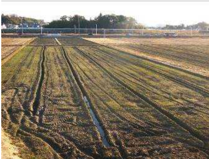
麦の芽が薄緑色を見せ始めている

朝は寒いが昼間は気温9℃ほどです。一日中晴天で夕方にも遠方の雪山がよく見えました。