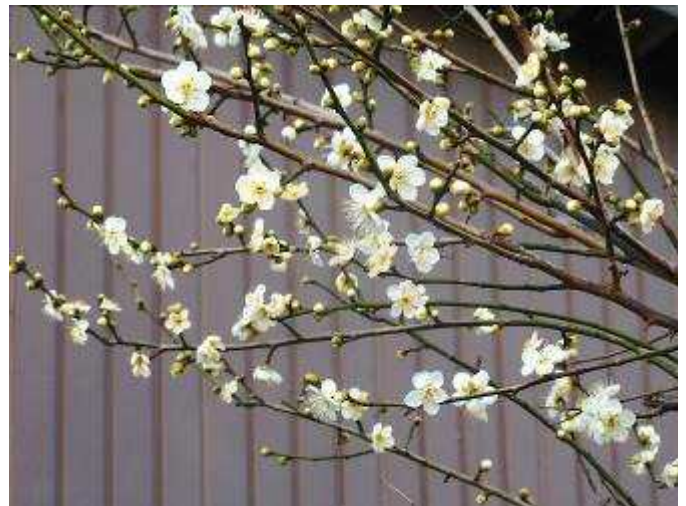
我が家の梅の木に花が