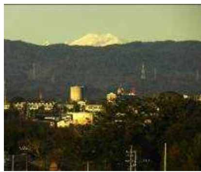
雪の木曽の御岳山