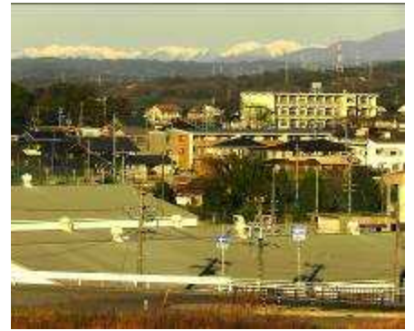
-雪の中央アルプス