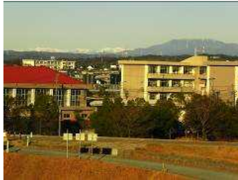
中央アルプス 恵那山