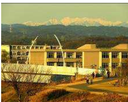
-雪の中央アルプス