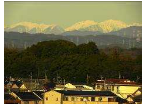
-雪の中央アルプス