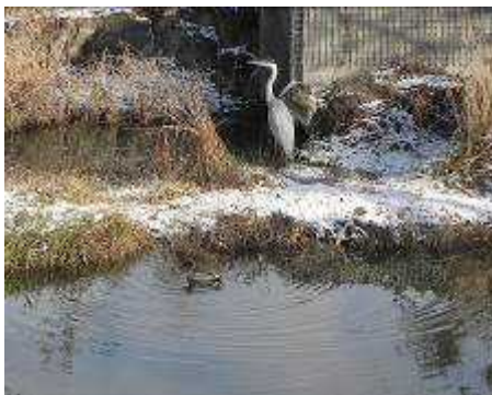
アオサギとコガモ