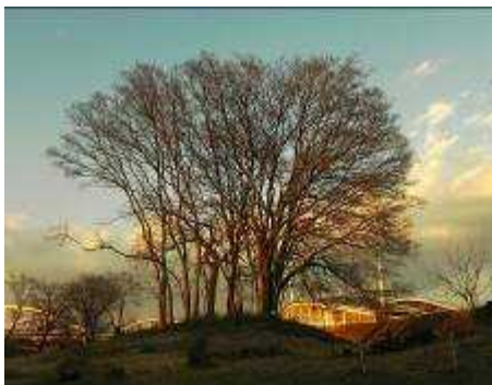
河川敷の樹木と豊田スタジアム