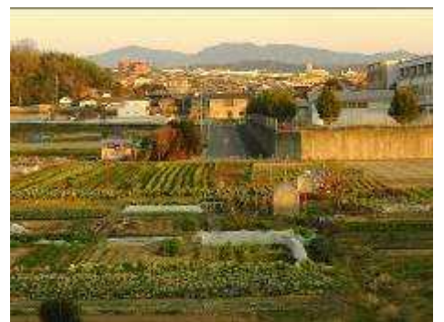
豊田東高校の背景は炮烙山・六所山