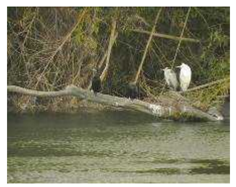
カワウ アオサギ ダイサギ