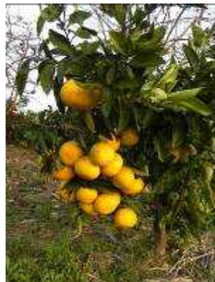
グレープフルーツ