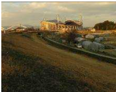
堤防からの豊田スタジアム