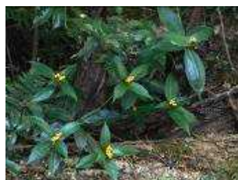
キミノセンリョウ