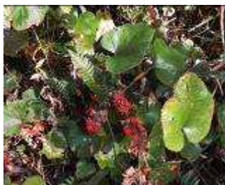
フユイチゴの果実