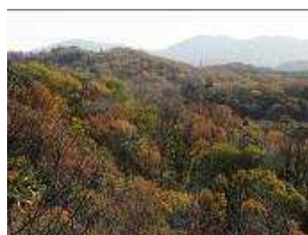
遠方に炮炉山・六所山