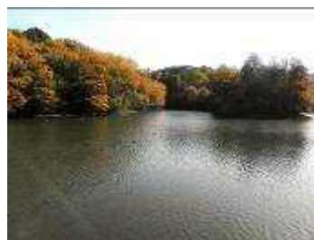
上池のマガモの群