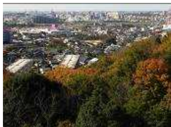
展望台からの市街地