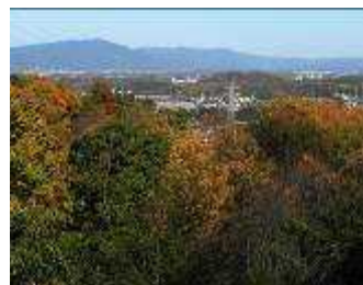
展望台からの猿投山