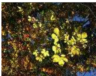
コシアブラの黄葉