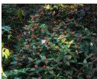
センリョウの赤い実